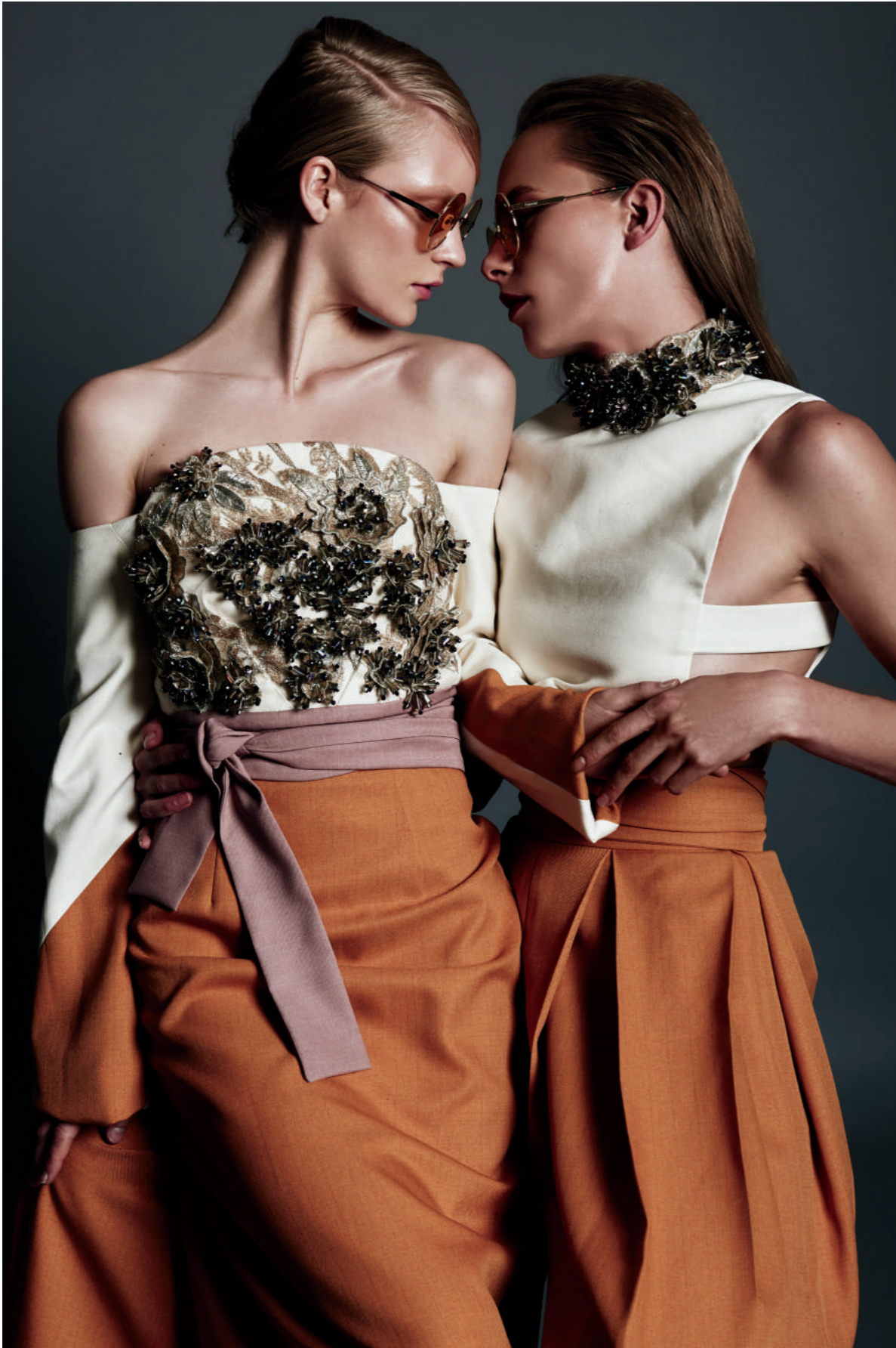
Total Looks JESÚS DE LA GARSA / Lentes POLAROID Total Looks LUCIANA BALDERRAMA