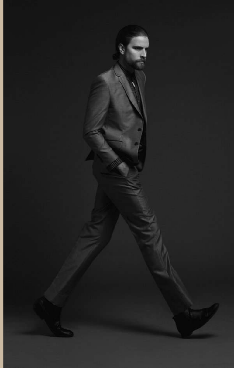
Total Look GALO BERTÍN / Botines H & M