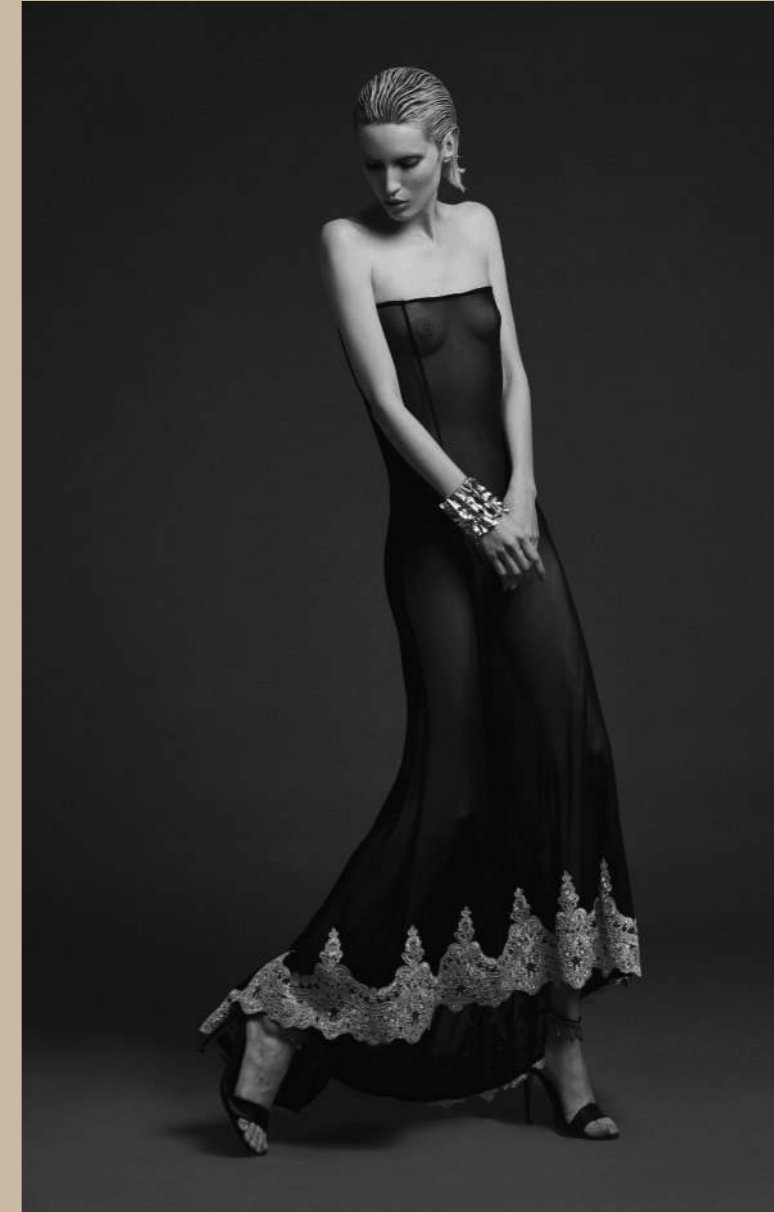
Vestido MAYA HANSEN / Aretes FERNANDO RODRÍGUEZ / Zapatos REBECA MIRANDA