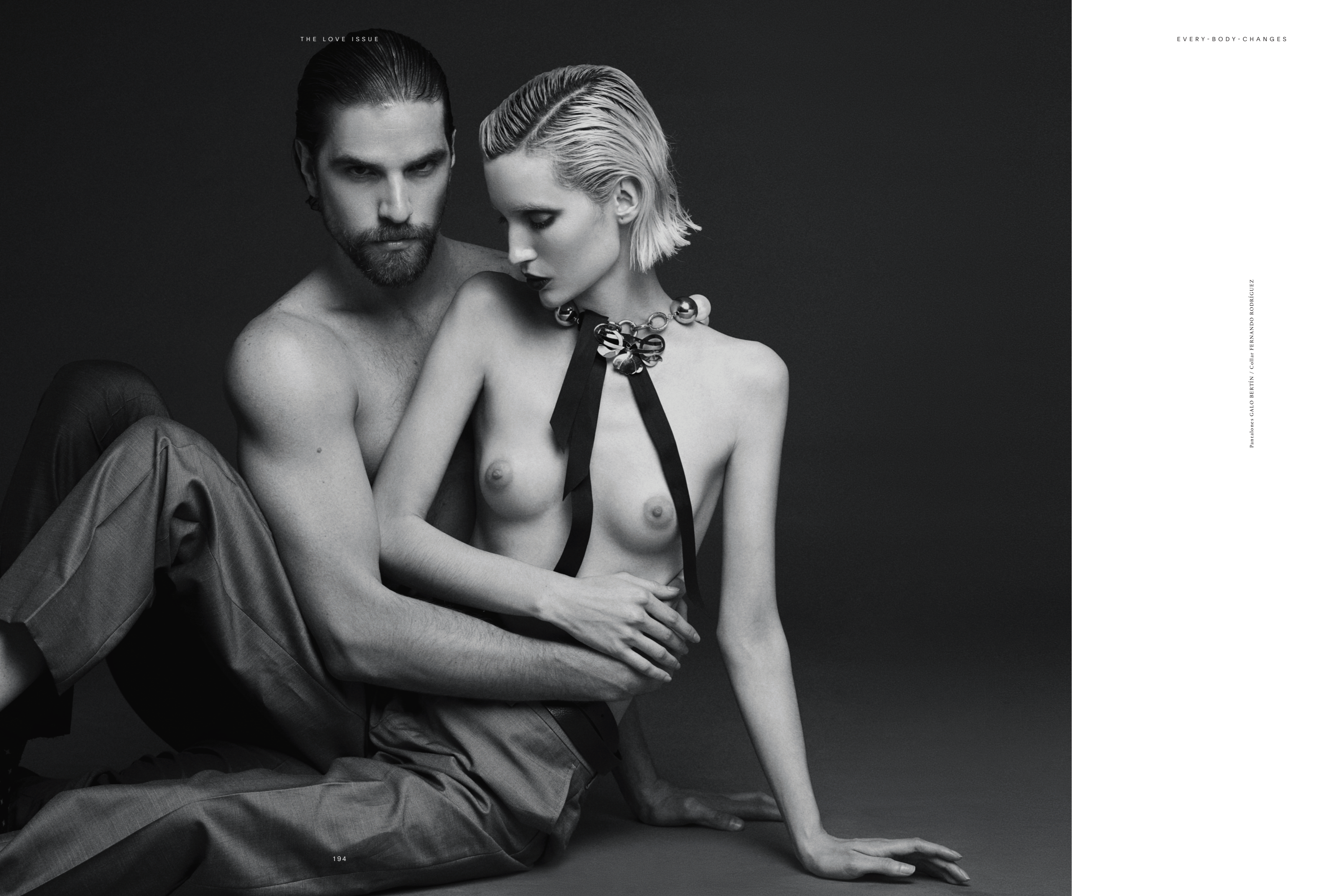
Pantalones GALO BERTÍN / Collar FERNANDO RODRÍGUEZ