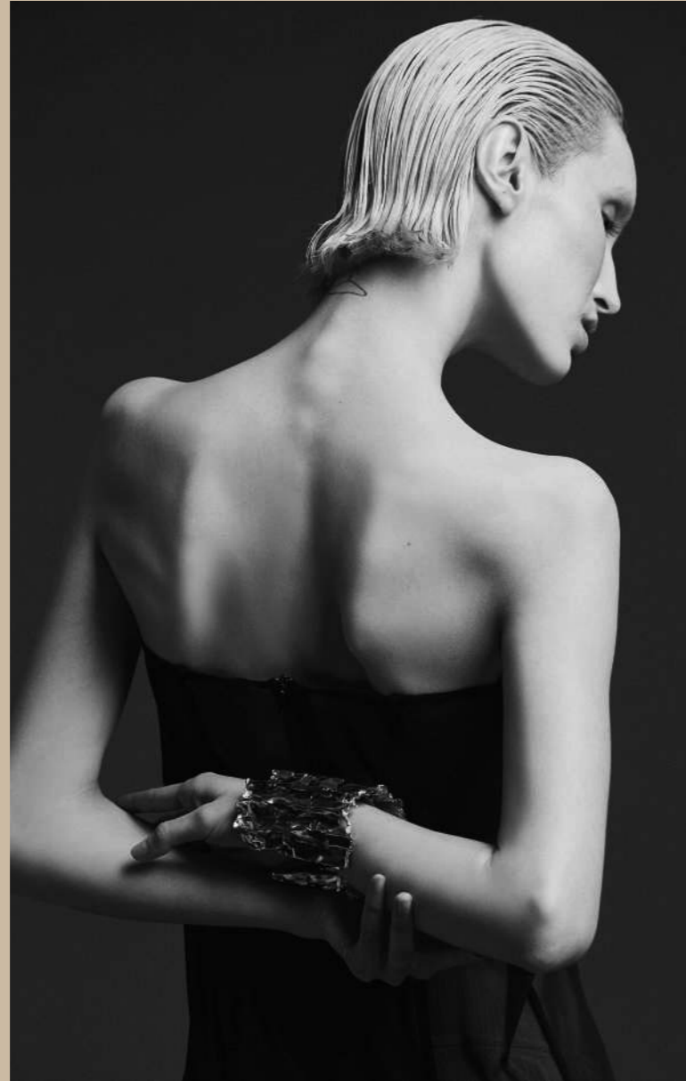
Vestido MAYA HANSEN / Brazaletes FERNANDO RODRÍGUEZ